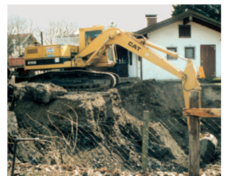
Bau unseres Proben-Kellerraums 1993 hinter unserer Hütte.