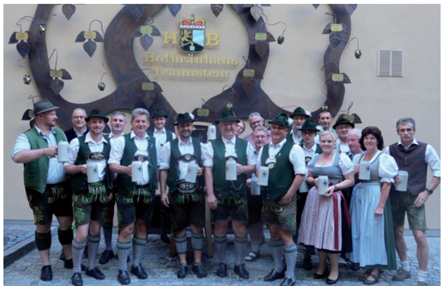
Bierzeltgemeinschaft und Festausschuss bei der Bierprobe im Hofbräuhaus Traunstein.

Erwartungsgemäß mundete der Trunk bestens und bei einer gemütlichen Brotzeit konnten die nächsten Arbeiten für die Festvorbereitung besprochen werden.